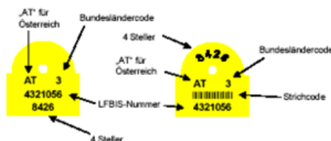
Abbildung 1: Gestaltung der Ohrmarke für Schweine gemäß § 22